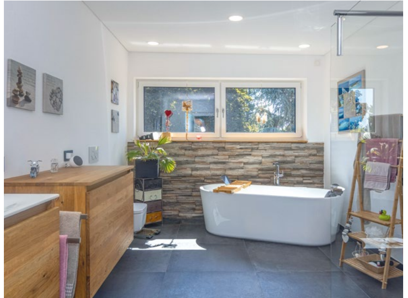
Das Bad im Obergeschoss mit form-schöner Eckbadewanne fällt großzügig aus.