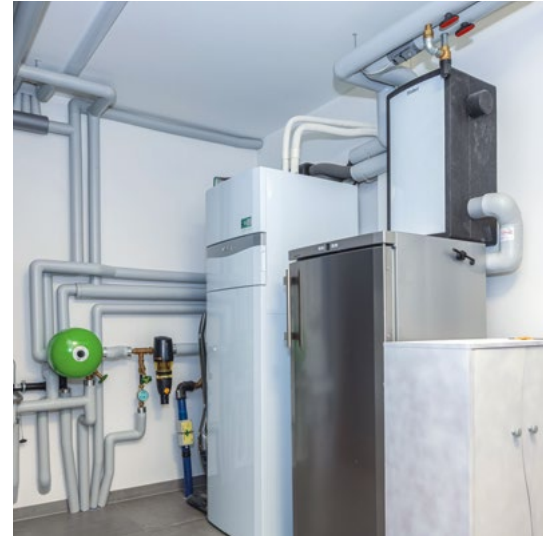
Die effizient arbeitende Luft-Wasser-Wärmepumpe sorgt für einen sparsamen Energieverbrauch.